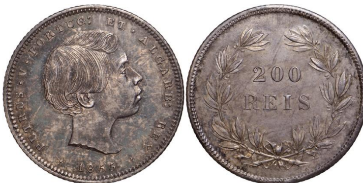
200 Réis 1855

O exemplar, sendo um ensaio em cobre, apresenta o peso de 3,87 g e o módulo de 23 mm. Não vem no Museu digital da Casa da Moeda a sua foto.