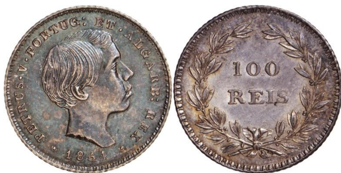
100 Réis 1854