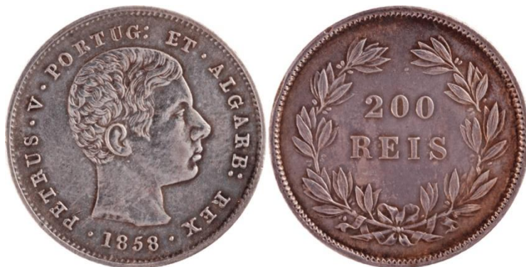
200 Réis 1858