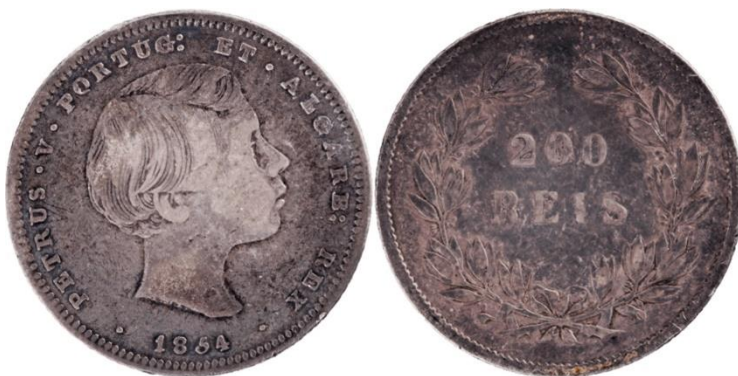
200 Réis 1854