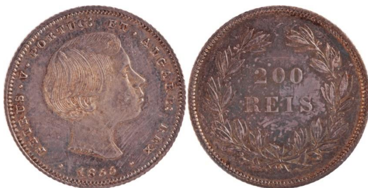
200 Réis 1855