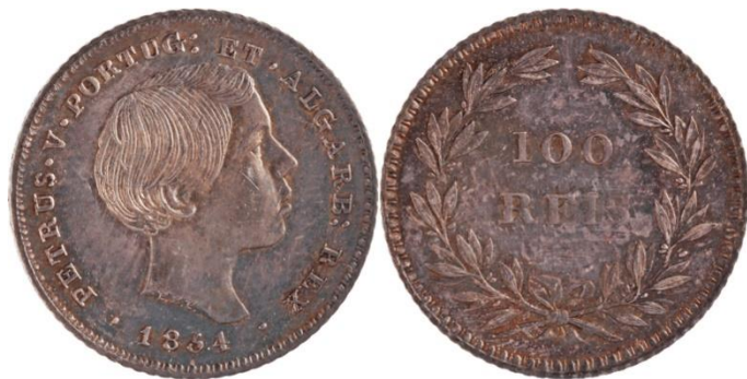
100 Réis 1854

O exemplar apresenta o peso de 2,50 g e o módulo de 19 mm.