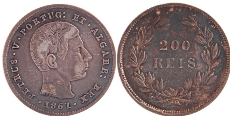
200 Réis 1861