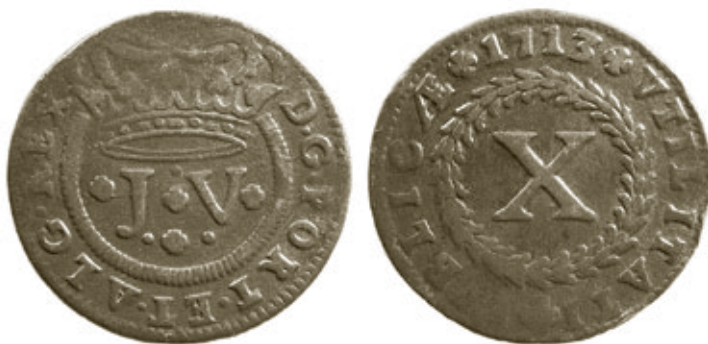
Cunho 5 de anverso e reverso 4, moeda 26, com 14,41g e 36mm, da colecção C.C.