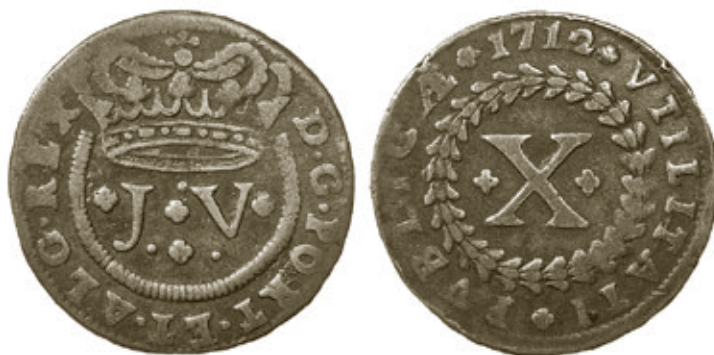
Moeda de X réis, com 11,55g e 35,5mm, da antiga colecção V. Cordeiro