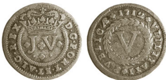
Moeda de V réis, com 6,46g e 31mm, da colecção A.B.