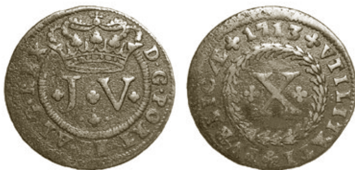
Cunho 11 de anverso e reverso 10, moeda 110, com 11,95g e 36mm, da colecção J.R.