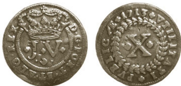
Cunho 10 de anverso e reverso 9, moeda 100, com 13,00g e 36,5mm, colecção J.M.A.