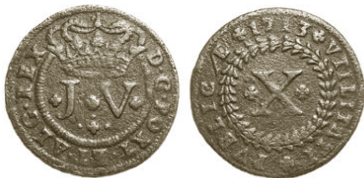
Cunho 11 de anverso e reverso 8, moeda 126 com 13,47g e 36mm, colecção J.L.