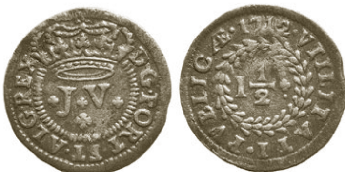
Moeda de I 1/2 réis, com 1,93g e 22mm, da colecção C.M.C.