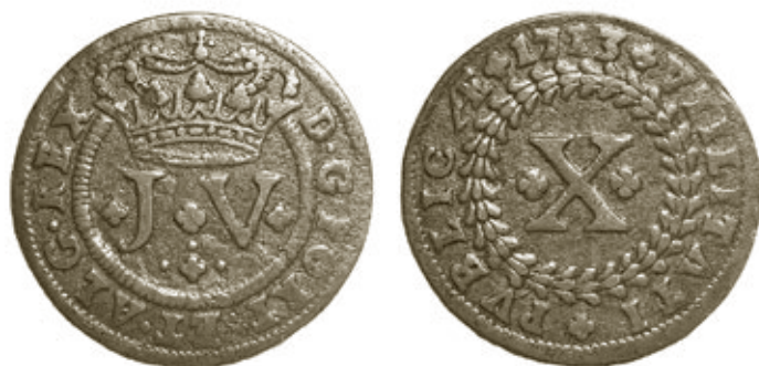
Cunho 11 de anverso com reverso 9, moeda 107, com 12,51g e 36,5mm, do autor.