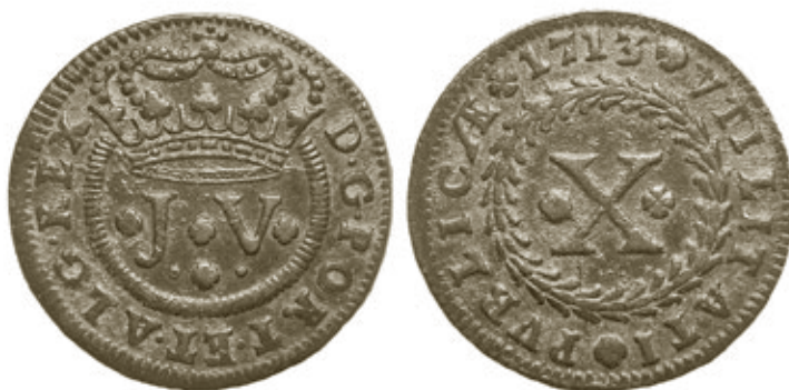
Cunhos 2, idem, moeda 4, com 14,12g e 36,5mm, da Biblioteca Nacional de Lisboa.