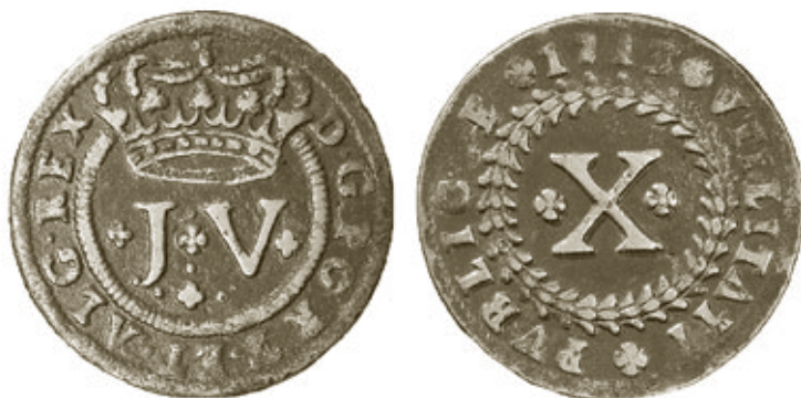
Cunho 8 de anverso com reverso 8, moeda 128 com 14,10g e 36,5mm, do autor.