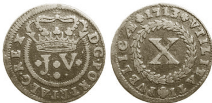
Cunho 7 de anverso com reverso 4, moeda 42, com 12,15g e 36mm, da colecção M.A.