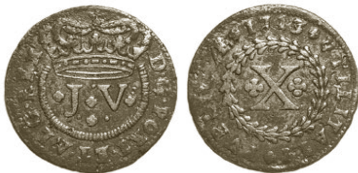
Cunhos 1 de anverso e reverso, do Quadro I, moeda 1, com 14,86g e 36mm, do autor