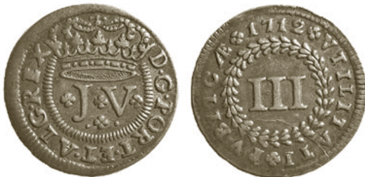
Moeda de III réis, com 4,26g e 26,5mm, da colecção C.M.C.