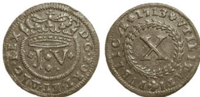
Cunho 6 de anverso com reverso 4, moeda 36, com 13,85g e 37mm, do autor.