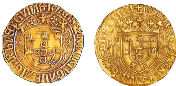
Lusitania vs. Porto