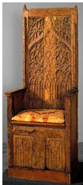
Cadeira gótica dita de D. Afonso V Museu Nacional de Arte Antiga