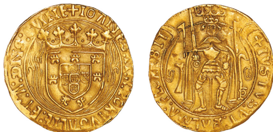
Numisma 100 - Porto?

Iho Monteiro, Junho 1926, It 25, ex-leilão Glendining da col. Robert Shore, Julho 1945; F Vaz J2.186 com desenho e foto do mesmo exemplar: 30 mm; 5,90 g