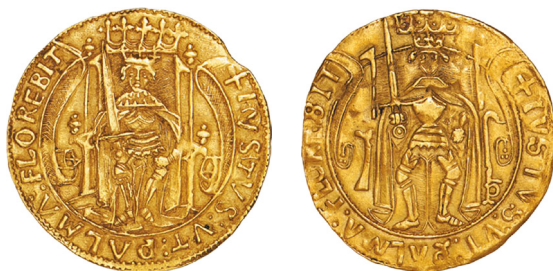
Numisma 100 Lisboa vs. Numisma 100 Porto

do reverso do seu tipo e sub-tipos IVS 1, 2 e 3, quer na ausência da cartela da legenda, que se dobra e enrola no campo inferior, quer na ausência da cadeira de espaldar alto gótico encimado por flores de lis, com guardas laterais encimadas por pomos, quer pela figuração do rei, armado e couraçado, mas de pé, em vez de sentado na cadeira.