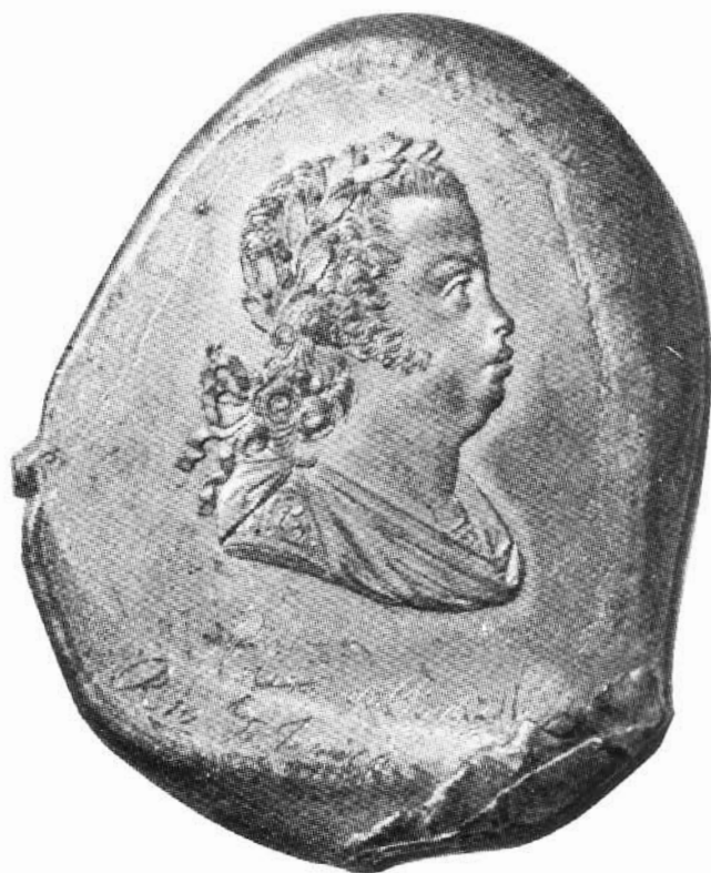
Domingos A. de Sequeira, del. Real Efígie de D. João P. o Cypriano da Silva Moreira, grav. 1804/11 - Ensaio de estanho