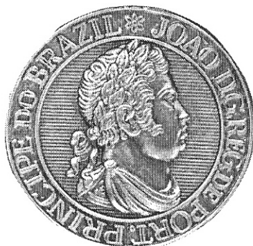
Busto ampliado da insígnia da Ordem da Torre e Espada cunhada em Lisboa.

Obs.: as imagens não correspondem ao tamanho real das peças.