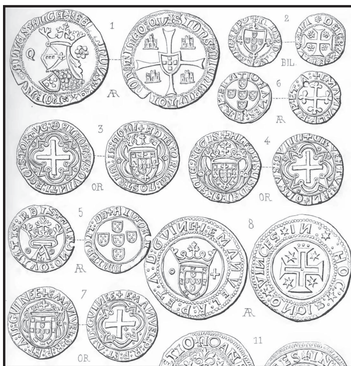
Pormenor da estampa publicada em 1885 na Revue Belge de Numismatique , onde vem desenhado sob o n.º 8 o primeiro exemplar conhecido do meio-português de prata de D. Manuel I

1956 – Cartilha de Numismática Portuguesa; e 1956-1960 – Preçário das Moedas Portuguesas, Pedro Batalha Reis. Inovador pelas reproduções fotográficas das moedas catalogadas, num inventário nacional de grande valor documental, estas obras pecam no entanto pela falta de descrição numismática das moedas. sem dúvida porque o autor considerou que a fotografia dispensava tal descrição, apenas assinalando as variantes mais notáveis. Daqui se infere que estes catálogos-preçários de Batalha Reis não têm interesse para este nosso estudo.