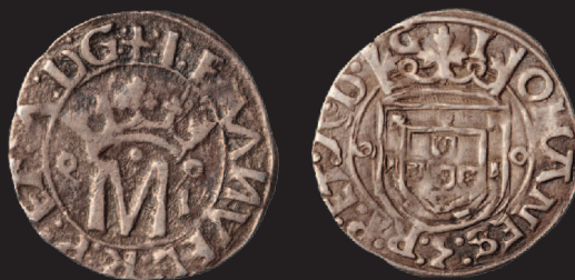
Cunhos de transição IOHANNES 3 // I EMANVEL Em cima: vintém híbrido do reverso; em baixo: ceitil e meio tostão híbridos do anverso