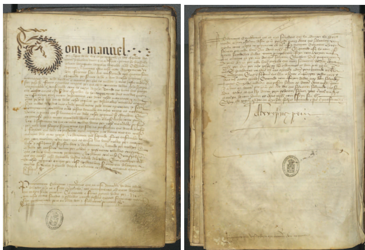
Primeiro e último fôlio do original do Regimento dado por D. Manuel às casas da Moeda do Reino em 1498

1498, Novembro 26: Redução do número de moedeiros em Lisboa – Nessa data foi feito o trespado em pública forma de quatro capítulos adicionais ao Regimento de Março de 1498,