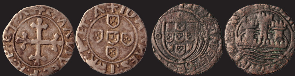
Cunhos de transição EMANVEL P // IOHANNES II Vintém híbrido do anverso; ceitil híbrido do reverso