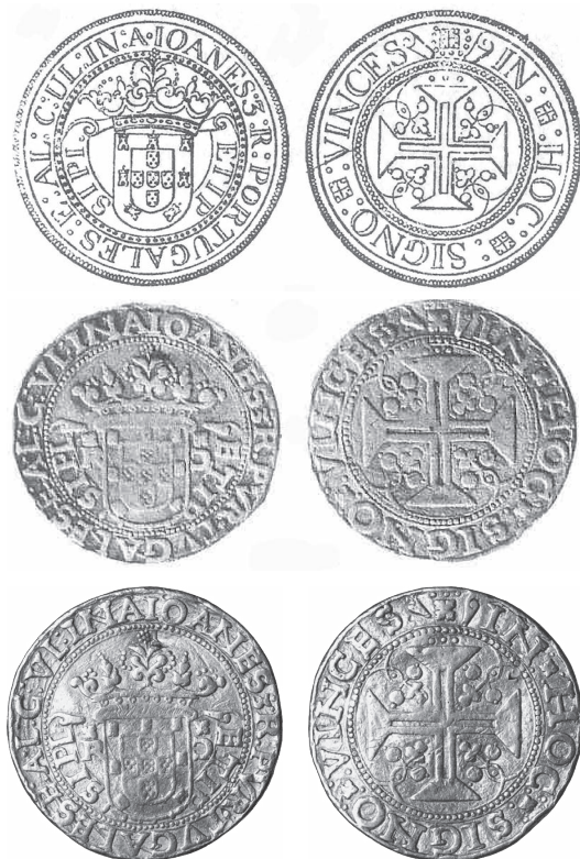
Foto 2 A, B e C. Desenho publicado em 1738 na História Genealógica (vol. IV, tab. H-57), dos exemplares IOA.56 e 57 e respectiva fotografia do catálogo Meili de 1910 e da coleção Carlos Costa. Não pertenceu à coleção do marquês de Abrantes, tendo sido adicionado por Caetano de Sousa à coleção de estampas da sua obra.

Reverso – cruz de Cristo encimada por três pontos em linha, o que nunca acontece nos exemplares deste tipo joanino renascentista (muito embora apareça em tostões de prata do período); a legenda e o florão separador (quadrifólio com três pontos cimeiros) não obedecem às características do reverso comum a todos os exemplares do tipo PT 5 (com VINCES); a cruz de Cristo está cantonada por ornatos floreados, frutos e folhas, o que nunca acontece nos exemplares deste tipo joanino renascentista, nem em nenhuma moeda portuguesa da época.