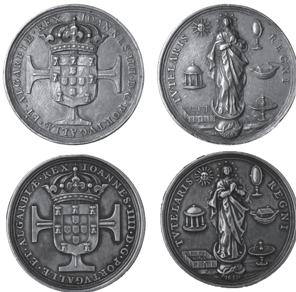
Foto 4 A e B. A Conceição de prata, exemplar CO 1.07, moeda original de D. João IV de 1648 (da colecção Carlos Costa), com anverso e reverso em comparação com a Conceição de 1650, exemplar CO 8.01 (da colecção Millenium BCP). A modernidade das suas gravuras denunciou a sua falsidade, o que foi confirmado pela aplicação do axioma numismático.

Um primeiro exemplar foi leiloadado em Amesterdão, em Outubro de 1927 (lote 57, peso 29,4 g). Um segundo exemplar apareceu nas colecções do Millennium BCP, certamente vindo dos acervos do Banco Português do Atlântico ou do FONSECAS e Burnay, tendo sido leiloadado em Lisboa em Março de 2013.