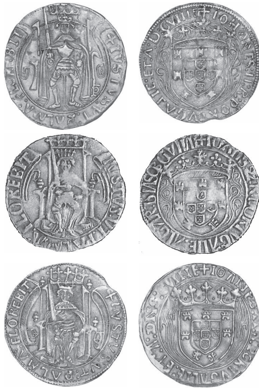
Foto 3 A, B e C. O Justo dito do Porto, com anverso e reverso em comparação com dois outros Justos de Lisboa (exemplar IVS 1.03, da Lusitânia Seguros e IVS 3.08, do leilão Numisma 100). As dúvidas que subsistiam sobre a genuinidade ou falsidade desse exemplar IVS 8.01, desapareceram após a aplicação do axioma numismático.

Segue a descrição deste último exemplar e a análise comparativa com os restantes.